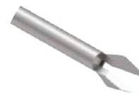
Pinça de Corte M Delta

Utilizado para raspagem das superfícies articulares