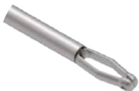
Pinça Coletora M Delta

Utilizado para coleta de tecidos e sutura do disco articular