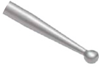
Cureta Esférica M Delta

Utilizado para raspagem e remoção de fragmentos ósseos