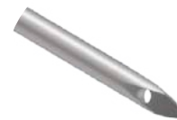
Agulha para Passagem de Fio M Delta

Utilizado para guiar o fio durante procedimentos cirúrgicos