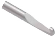
Gancho de Deslocamento M Delta

Utilizado para raspagem e remoção de fragmentos ósseos