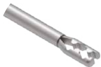
Pinça Auxiliar M Delta

Utilizado para incisões, raspagens e remoções de aderências ósseas